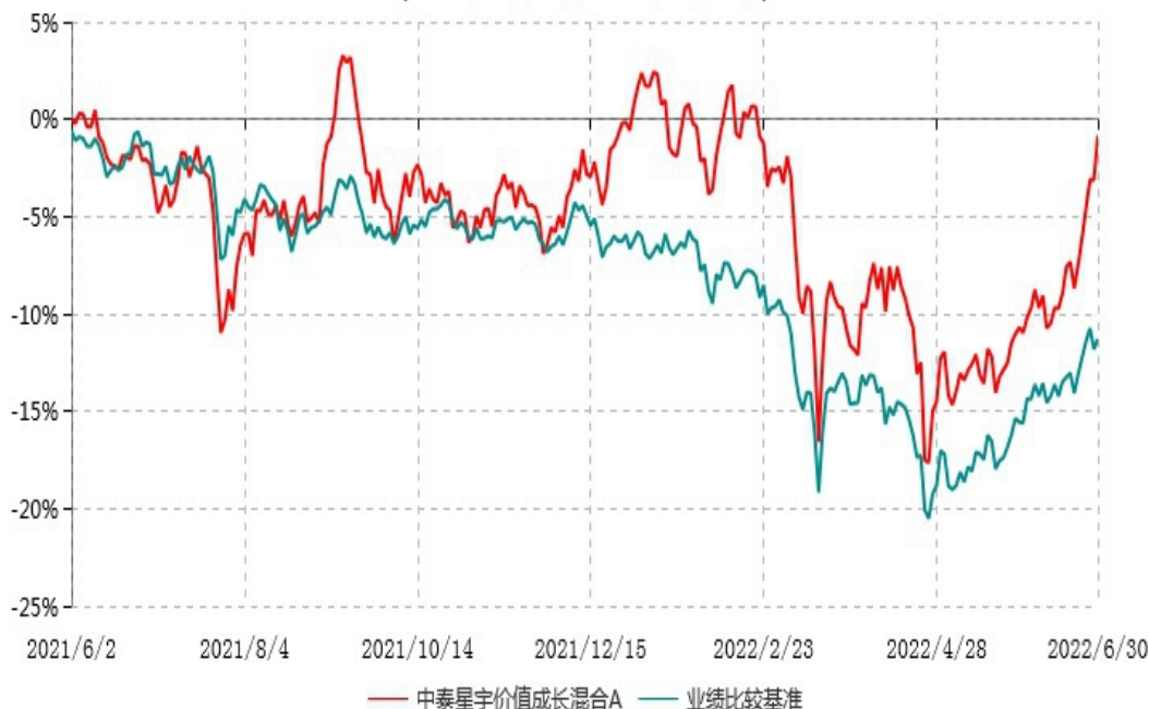
中泰星宇价值成长混合A累计净值增长率与业绩比较基准收益率历史走势对比图 (2021年06月02日-2022年06月30日)

注：根据基金合同约定，本基金自基金合同生效之日起 6 个月内为建仓期。建仓期结束时，本基金各项资产配置比例符合基金合同约定。