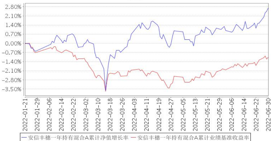
安信丰穗一年持有混合A累计净值增长率与同期业绩比较基准收益率的历史走势对比图