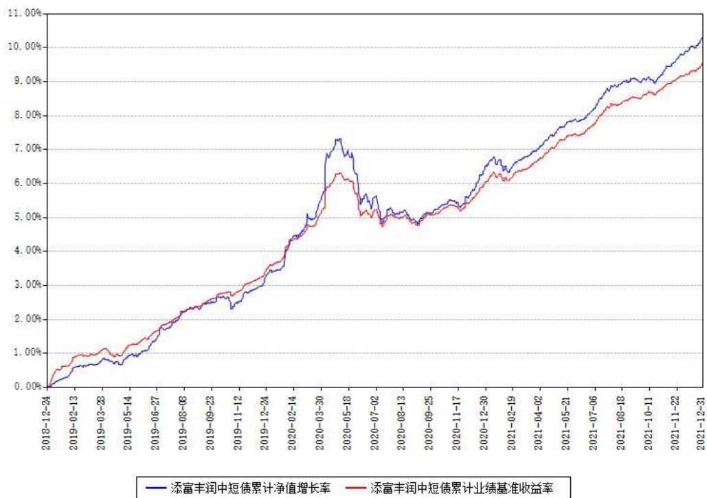
添富丰润中短债累计净值增长率与同期业绩基准收益率对比图