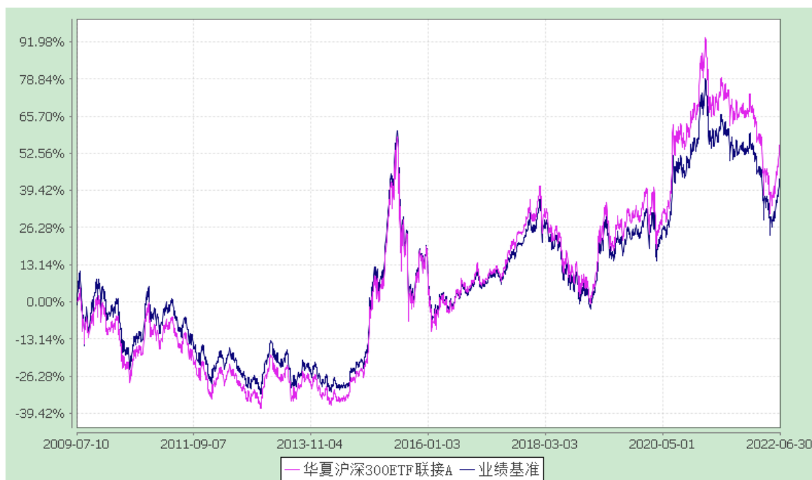
华夏沪深 300ETF 联接 C: