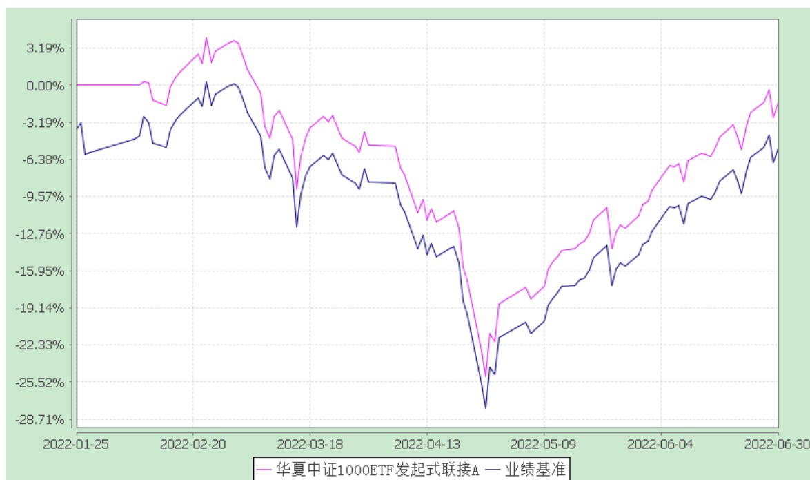
华夏中证 1000ETF 发起式联接 C: