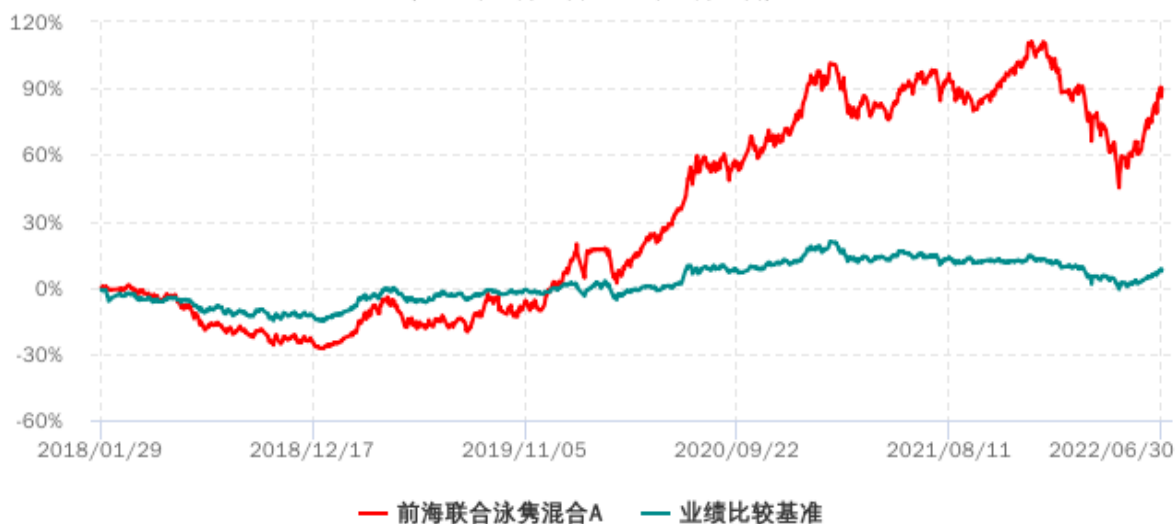
前海联合泳隼混合C累计净值增长率与业绩比较基准收益率历史走势对比图