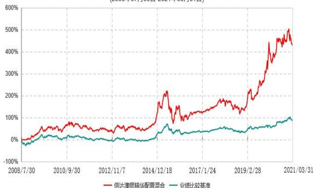
信达澳银精华灵活配置混合型证券投资基金累计净值增长率与业绩比较基准收益率历史走势对比图 (2008年07月30日-2021年03月31日)

注：1、本基金合同于 2008 年 7 月 30 日生效，2008 年 8 月 29 日开始办理申购、赎回业务。