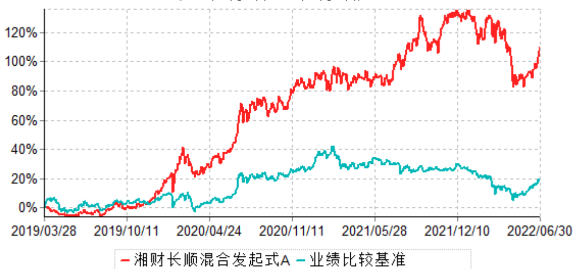
湘财长顺混合发起式A累计净值增长率与业绩比较基准收益率历史走势对比图 (2019年03月28日-2022年06月30日)