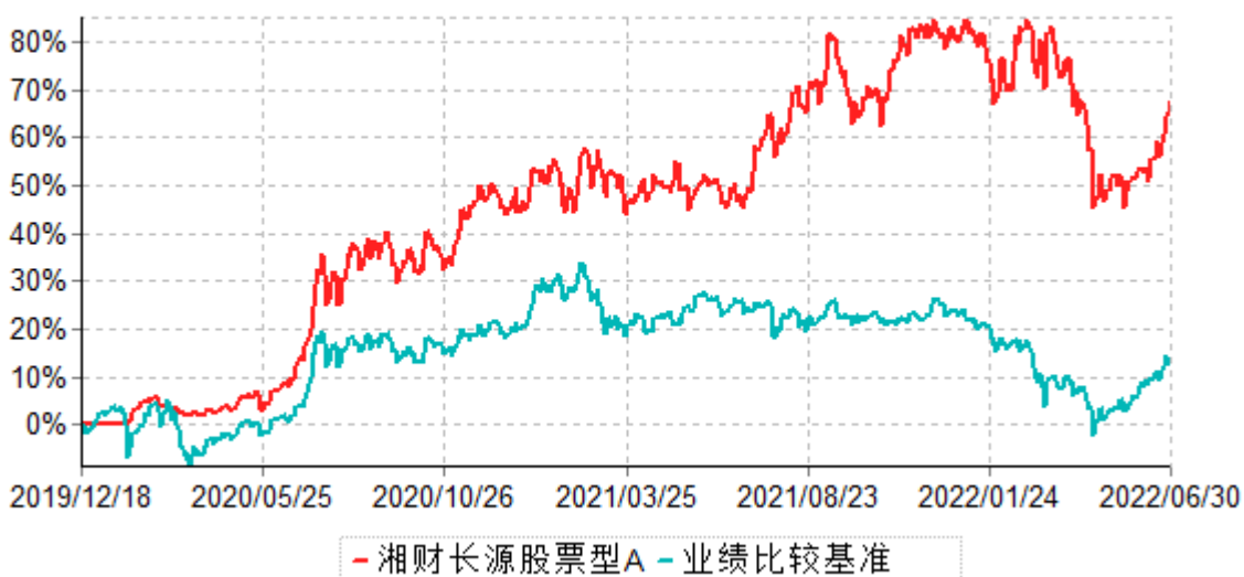
湘财长源股票型A累计净值增长率与业绩比较基准收益率历史走势对比图 (2019年12月18日-2022年06月30日)