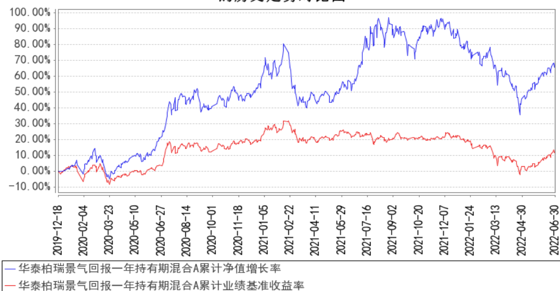
华泰柏瑞景气回报一年持有期混合A累计净值增长率与同期业绩比较基准收益率的历史走势对比图