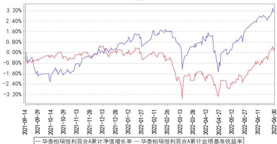
华泰柏瑞恒利混合A累计净值增长率与同期业绩比较基准收益率的历史走势对比图