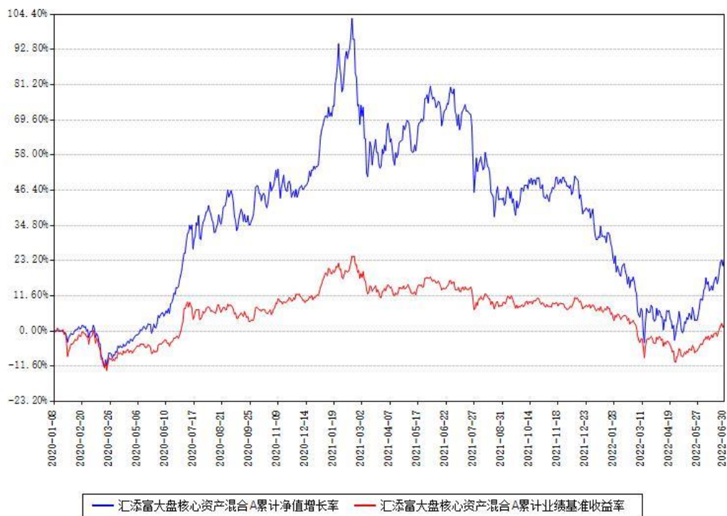
汇添富大盘核心资产混合A累计净值增长率与同期业绩基准收益率对比图