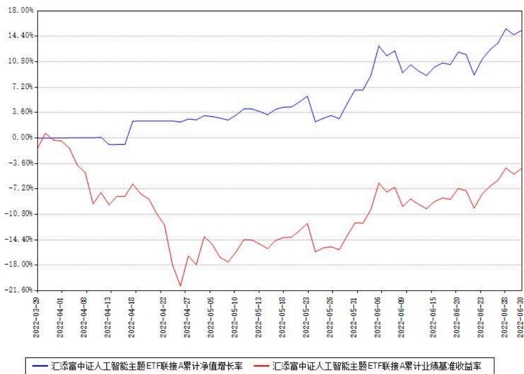
汇添富中证人工智能主题ETF联接A累计净值增长率与同期业绩基准收益率对比图