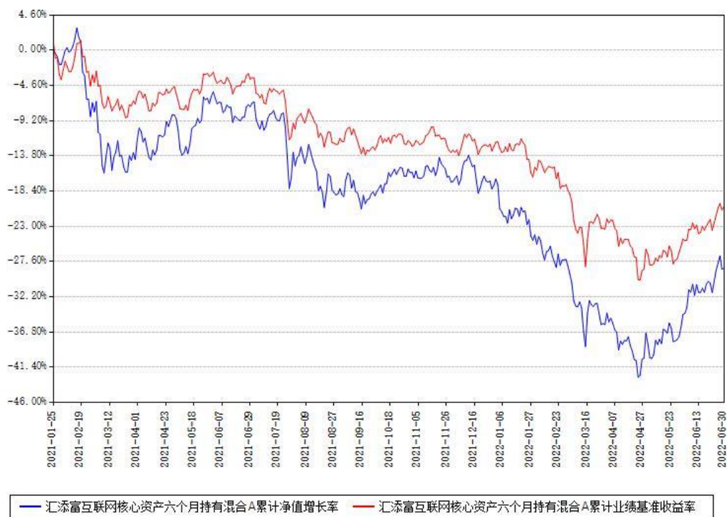
汇添富互联网核心资产六个月持有混合A累计净值增长率与同期业绩基准收益率对比图