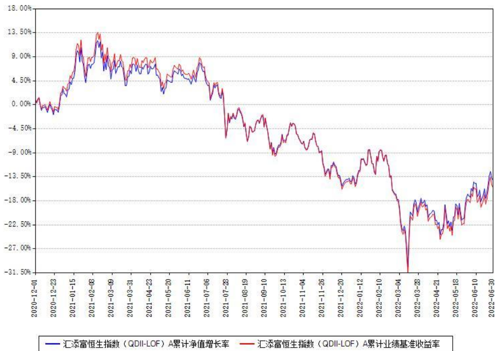
汇添富恒生指数（QDII-LOF）C 累计净值增长率与同期业绩基准收益率对比图