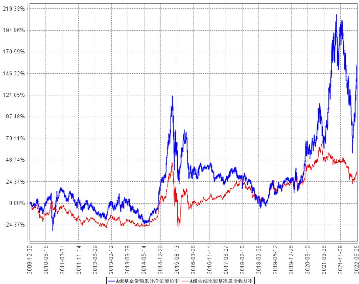
A 级基金份额累计净值增长率与同期业绩比较基准收益率的历史走势对比图