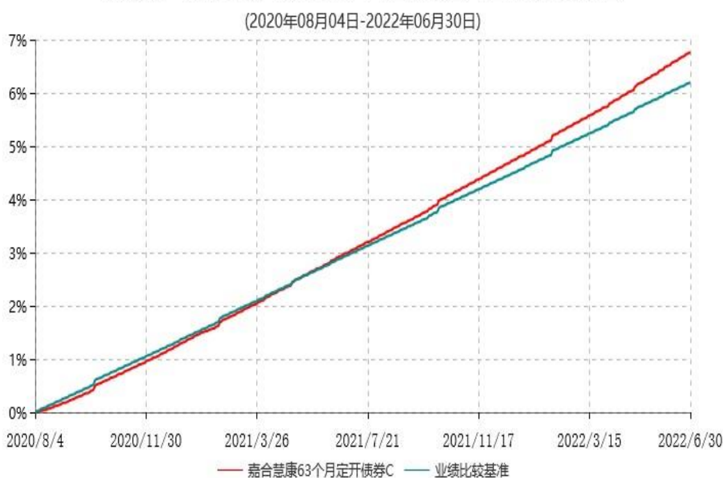
嘉合慧康63个月定开债券C累计净值增长率与业绩比较基准收益率历史走势对比图