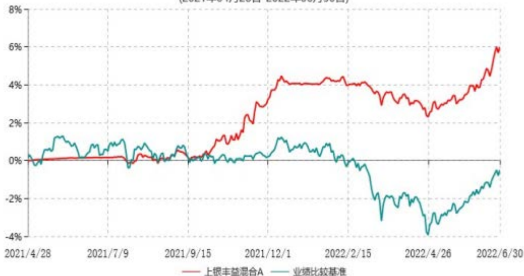
上银丰益混合C累计净值增长率与业绩比较基准收益率历史走势对比图