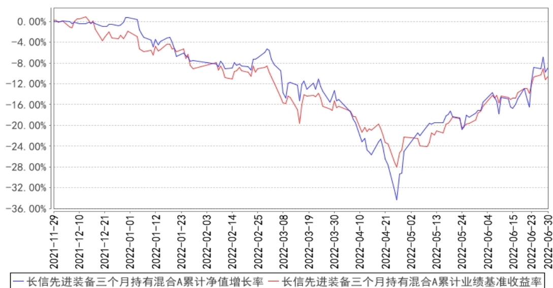
长信先进装备三个月持有混合A累计净值增长率与同期业绩比较基准收益率的历史走势对比图