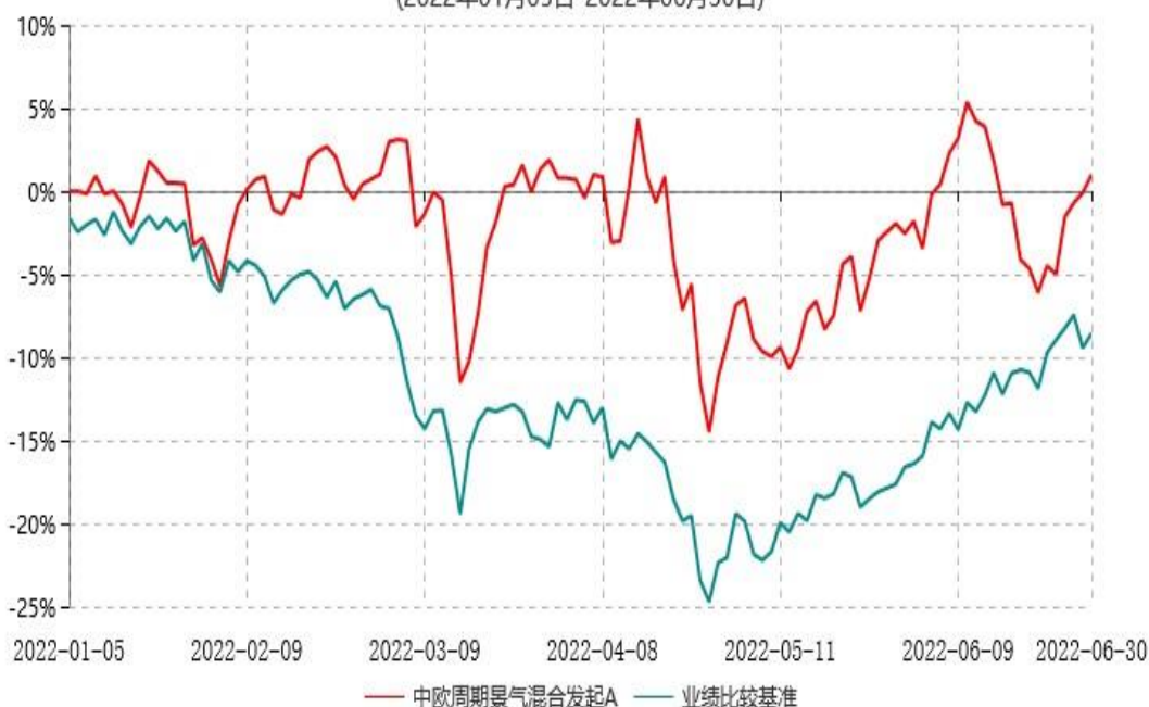
中欧周期景气混合发起A累计净值增长率与业绩比较基准收益率历史走势对比图 (2022年01月05日-2022年06月30日)

注：本基金基金合同生效日期为 2022 年 1 月 5 日，自基金合同生效日起到本报告期末不满一年，按基金合同的规定，本基金自基金合同生效起六个月为建仓期，建仓期结束时各项资产配置比例应当符合基金合同约定。