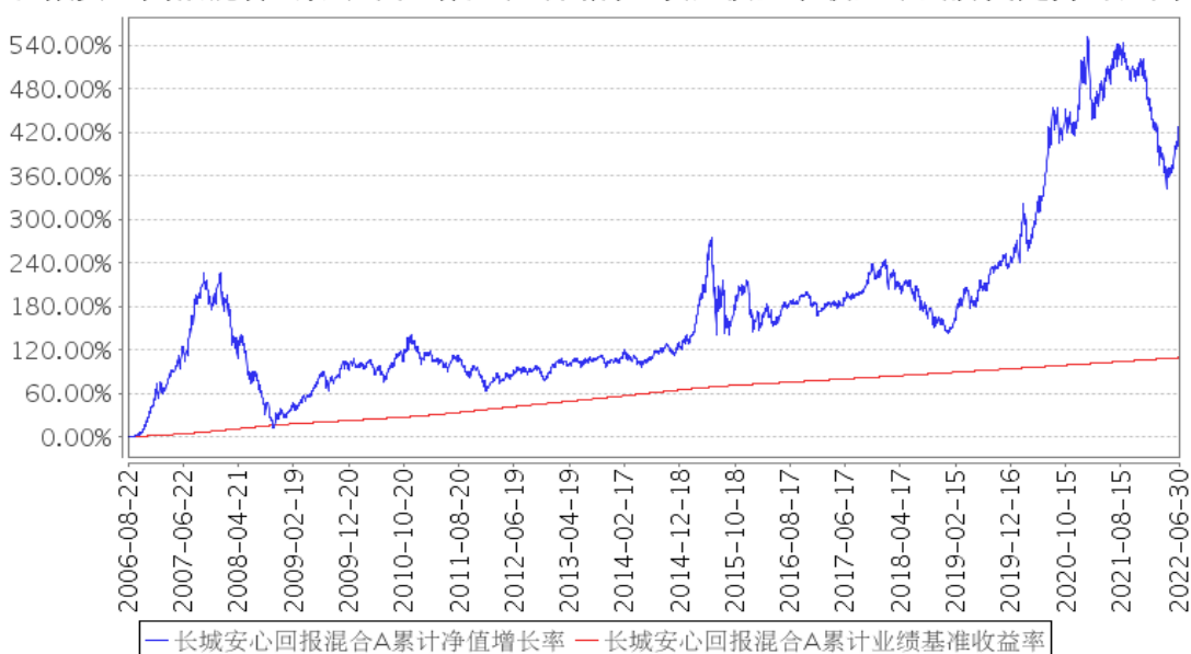
长城安心回报混合A累计净值增长率与同期业绩比较基准收益率的历史走势对比图