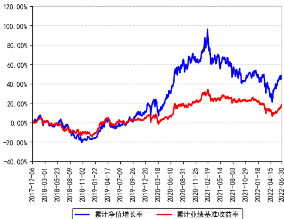
南方优享分红混合A累计净值增长率与同期业绩比较基准收益率的历史走势对比图