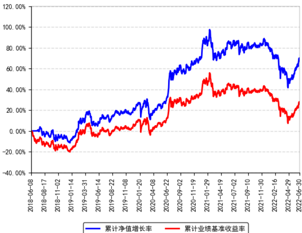
MSCI 联接A累计净值增长率与同期业绩比较基准收益率的历史走势对比图