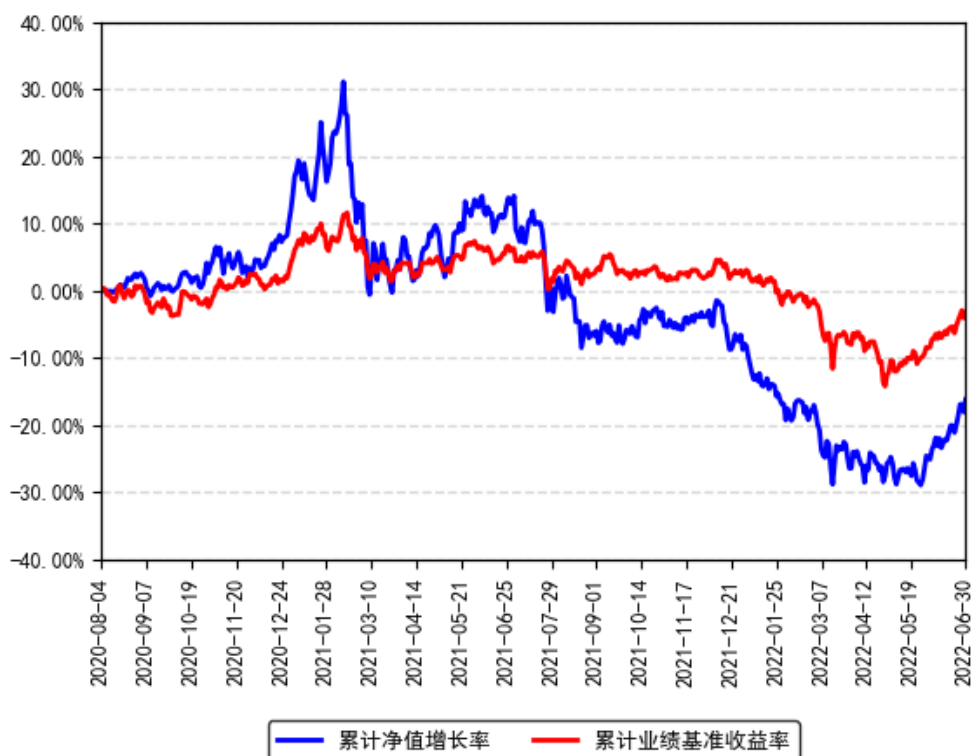
南方景气驱动混合A累计净值增长率与同期业绩比较基准收益率的历史走势对比图