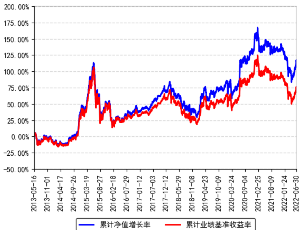
南方300联接A累计净值增长率与同期业绩比较基准收益率的历史走势对比图