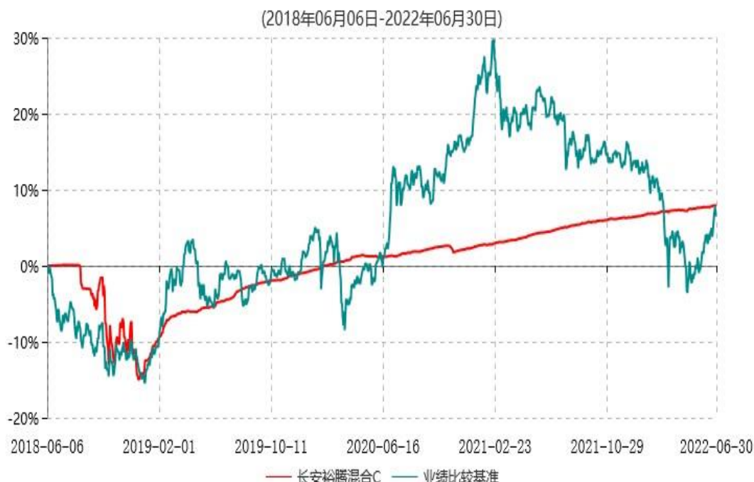
长安裕腾混合C累计净值增长率与业绩比较基准收益率历史走势对比图

根据基金合同的规定,自基金合同生效之日起6个月内基金各项资产配置比例需符合基金合同要求。本基金在建仓期结束后,各项资产配置比例已符合基金合同有关投资比例的约定。基金合同生效日至报告期末,本基金运作时间已满一年。图示日期为2018年06月06日至2022年6月30日。