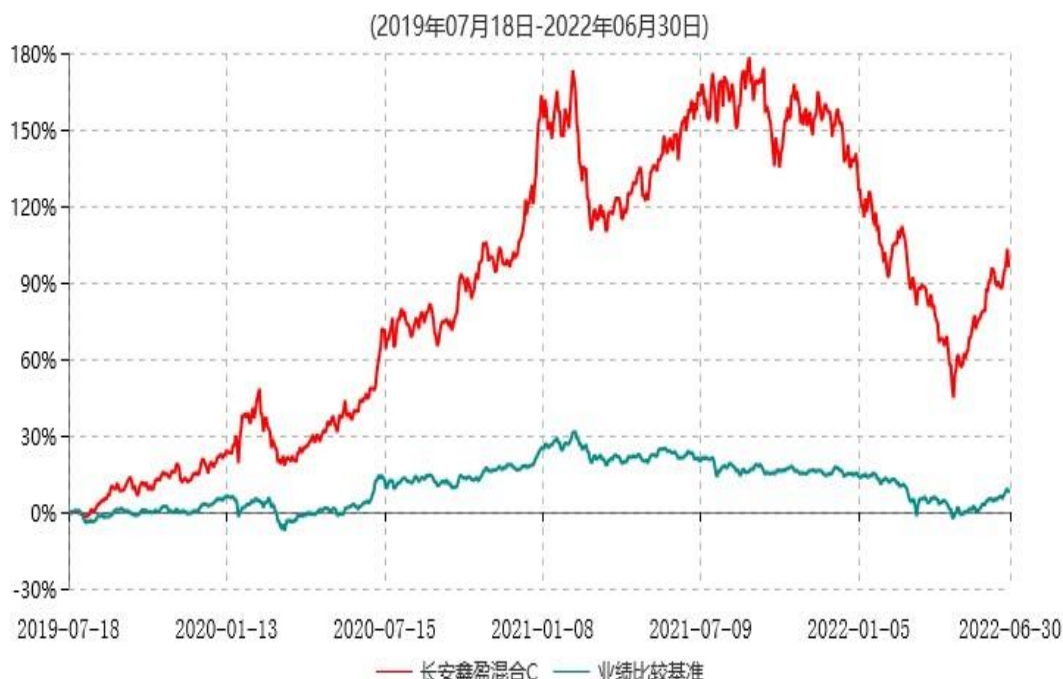
长安鑫盈混合C累计净值增长率与业绩比较基准收益率历史走势对比图

根据基金合同的规定,自基金合同生效之日起6个月内基金各项资产配置比例需符合基金合同要求。本基金在建仓期结束后,各项资产配置比例已符合基金合同有关投资比例的约定。基金合同生效日至报告期期末,本基金运作时间超过一年。图示日期为2019年07月18日至2022年06月30日止。