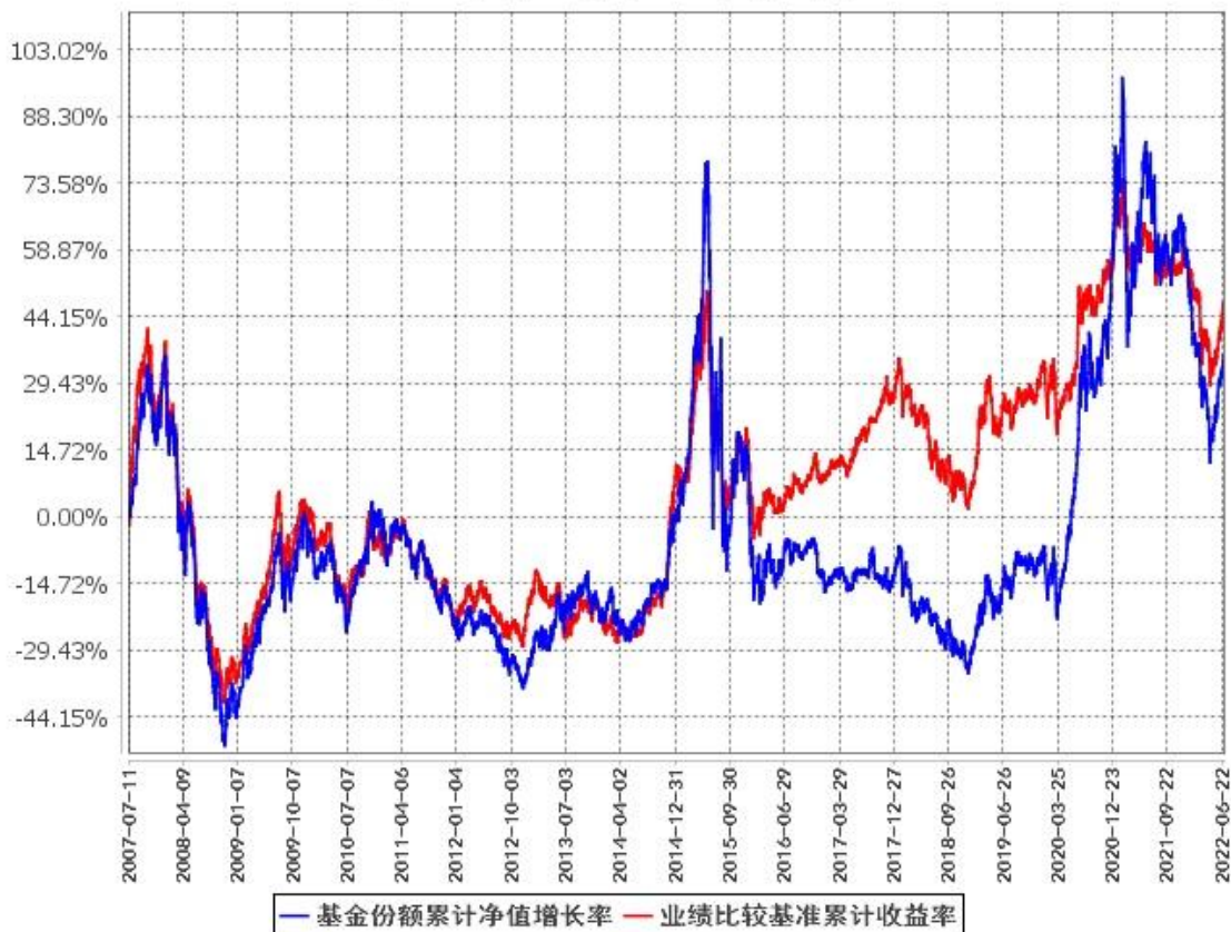
基金份额累计净值增长率与同期业绩比较基准收益率的历史走势对比图 (2007年7月11日至2022年6月30日)

注：1、按照本基金的基金合同约定，本基金自2007年7月11日合同生效之日起六个月内使基金的投资组合比例符合基金合同的约定。