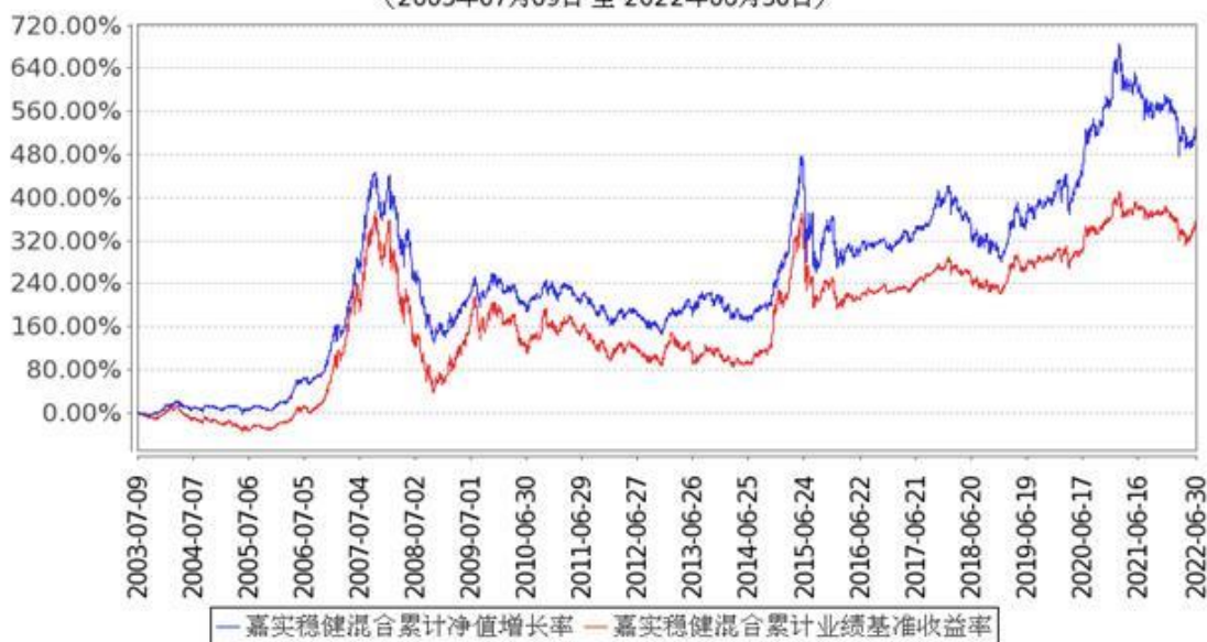
图：嘉实稳健混合份额累计净值增长率与同期业绩比较基准收益率的历史走势对比图