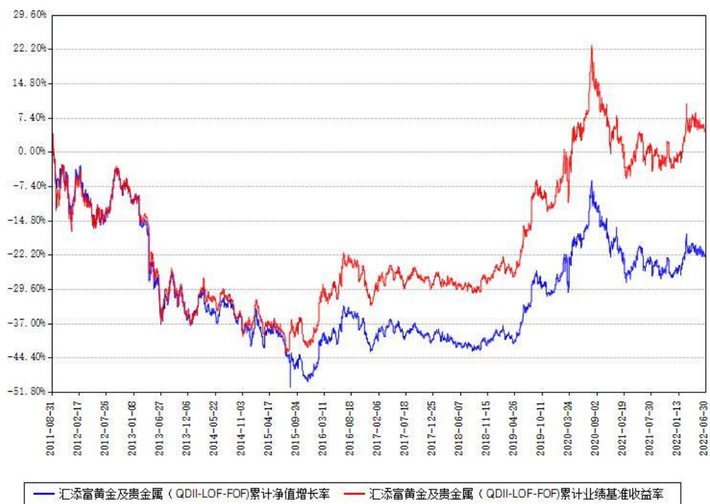
汇添富黄金及贵金属（QDII-LOF-FOF）累计净值增长率与同期业绩基准收益率对比图