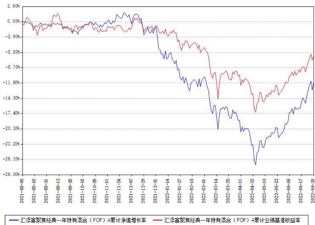
汇添富聚焦经典一年持有混合（FOF）A累计净值增长率与同期业绩基准收益率对比图

(二)自基金合同生效以来基金累计净值增长率变动及其与同期业绩比较基准收益率变动的比较图