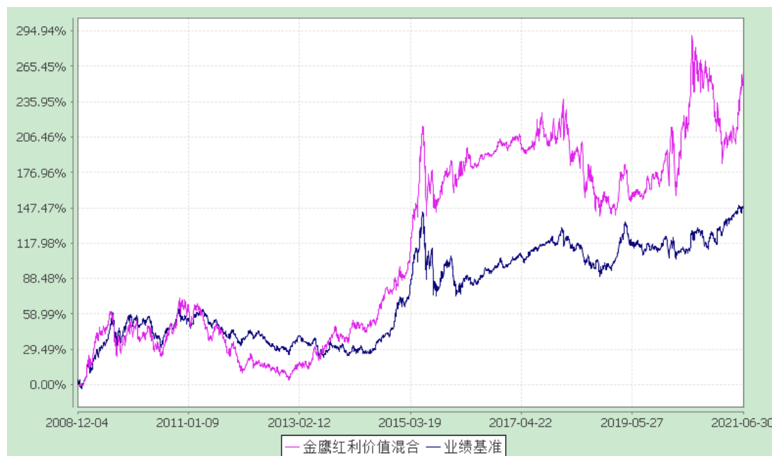
金鹰红利价值灵活配置混合型证券投资基金 累计净值增长率与业绩比较基准收益率历史走势对比图 (2008年12月4日至2021年6月30日)