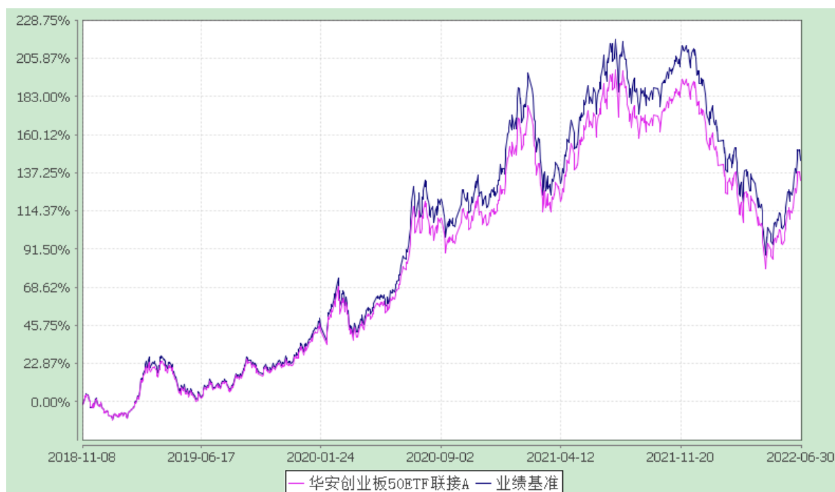
华安创业板 50ETF 联接 C