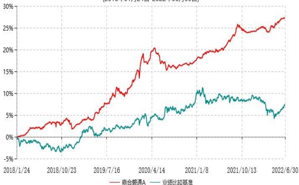
嘉合磐通A累计净值增长率与业绩比较基准收益率历史走势对比图 (2018年01月24日-2022年06月30日)