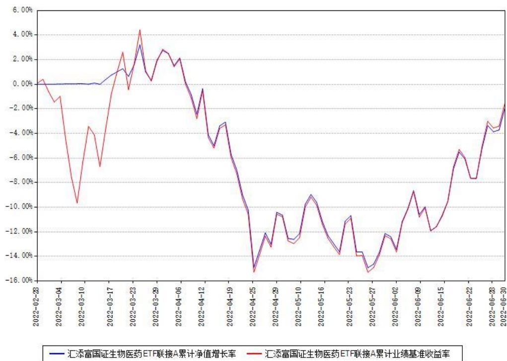
汇添富国证生物医药ETF联接A累计净值增长率与同期业绩基准收益率对比图