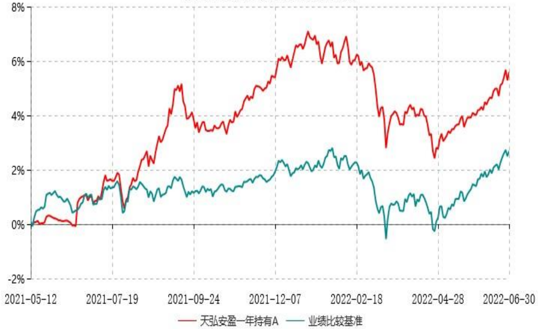
天弘安盈一年持有C累计净值增长率与业绩比较基准收益率历史走势对比图