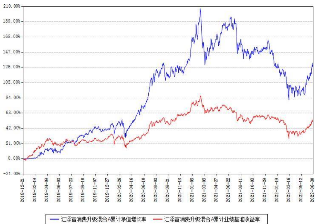
汇添富消费升级混合A累计净值增长率与同期业绩比较基准收益率对比图