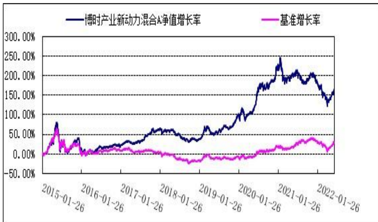
博时产业新动力混合 C