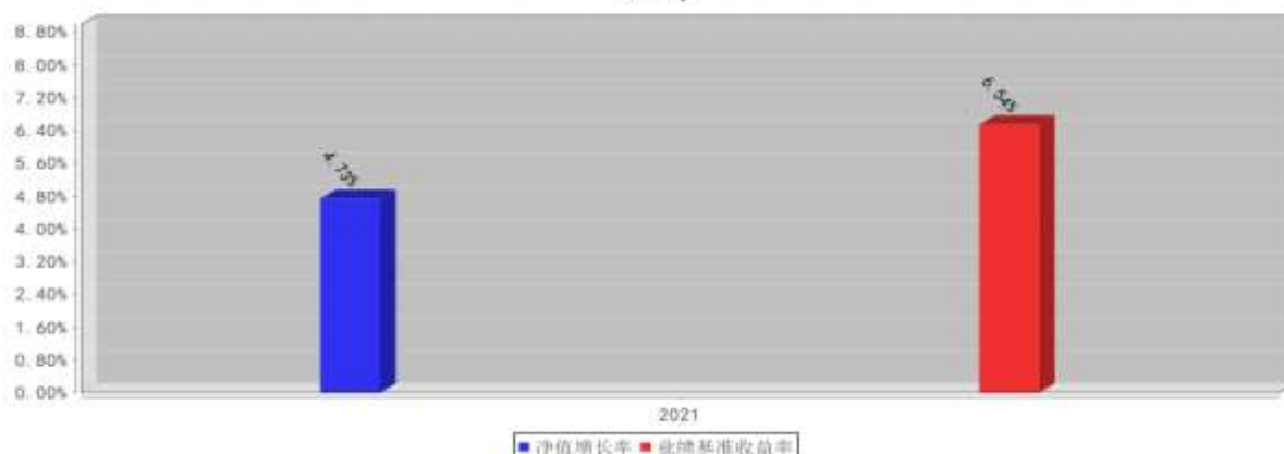
西部利得中证人工智能主题指数增强C基金每年净值增长率与同期业绩比较基准收益率的对比图(2021年12月31日)