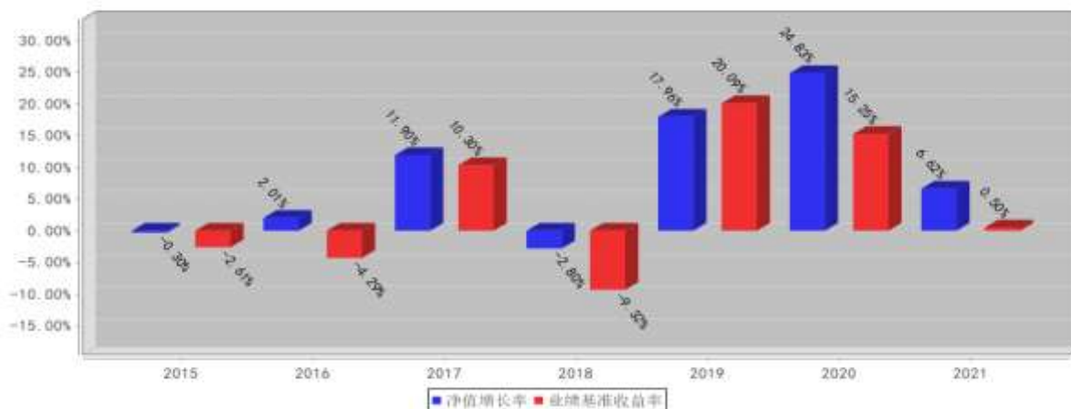
西部利得多策略优选混合基金每年净值增长率与同期业绩比较基准收益率的对比图(2021年12月31日)