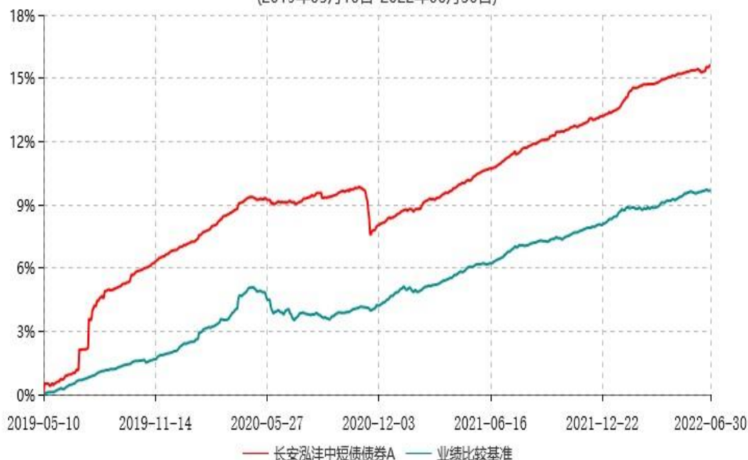
长安泓沣中短债债券A累计净值增长率与业绩比较基准收益率历史走势对比图 (2019年05月10日-2022年06月30日)