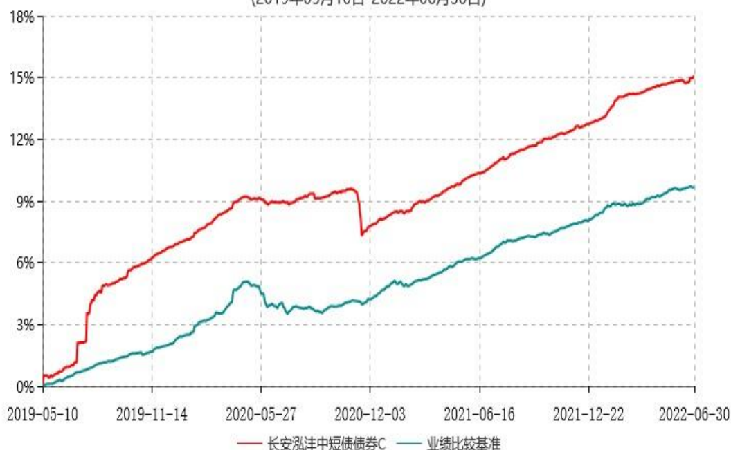
长安泓沣中短债债券C累计净值增长率与业绩比较基准收益率历史走势对比图 (2019年05月10日-2022年06月30日)