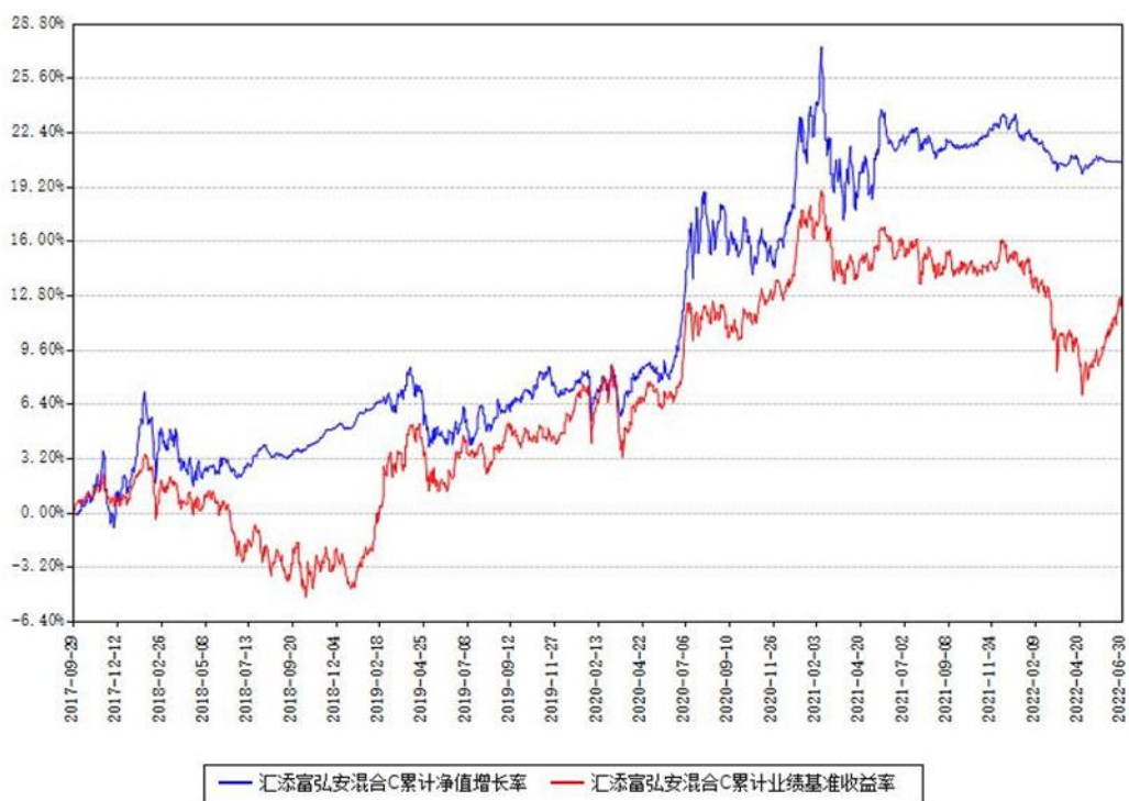
汇添富弘安混合C累计净值增长率与同期业绩基准收益率对比图