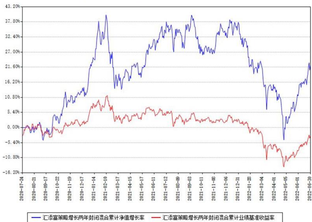
汇添富策略增长两年封闭混合累计净值增长率与同期业绩基准收益率对比图