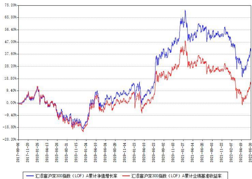
汇添富沪深300指数 (LOF) A 累计净值增长率与同期业绩基准收益率对比图