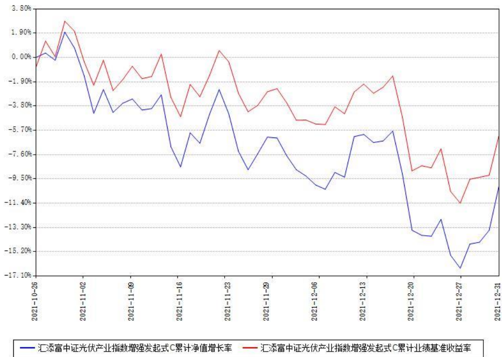
汇添富中证光伏产业指数增强发起式C累计净值增长率与同期业绩基准收益率对比图