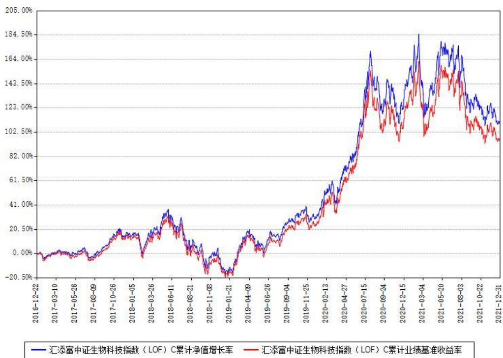
汇添富中证生物科技指数（LOF）C累计净值增长率与同期业绩基准收益率对比图