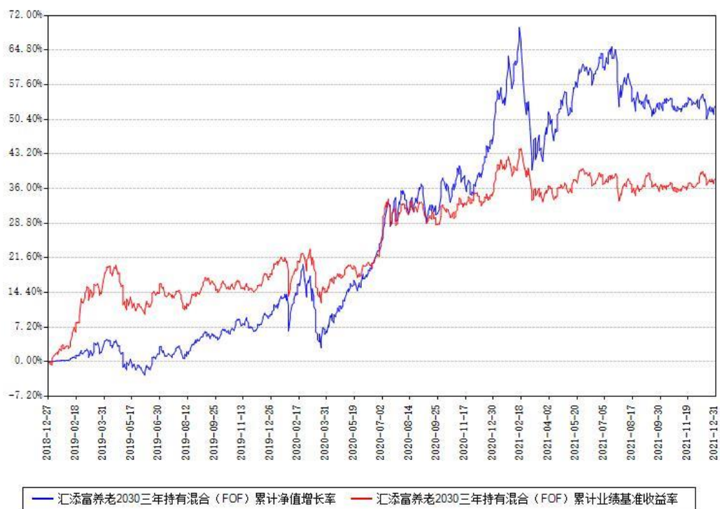
汇添富养老2030三年持有混合 (FOF) 累计净值增长率与同期业绩基准收益率对比图