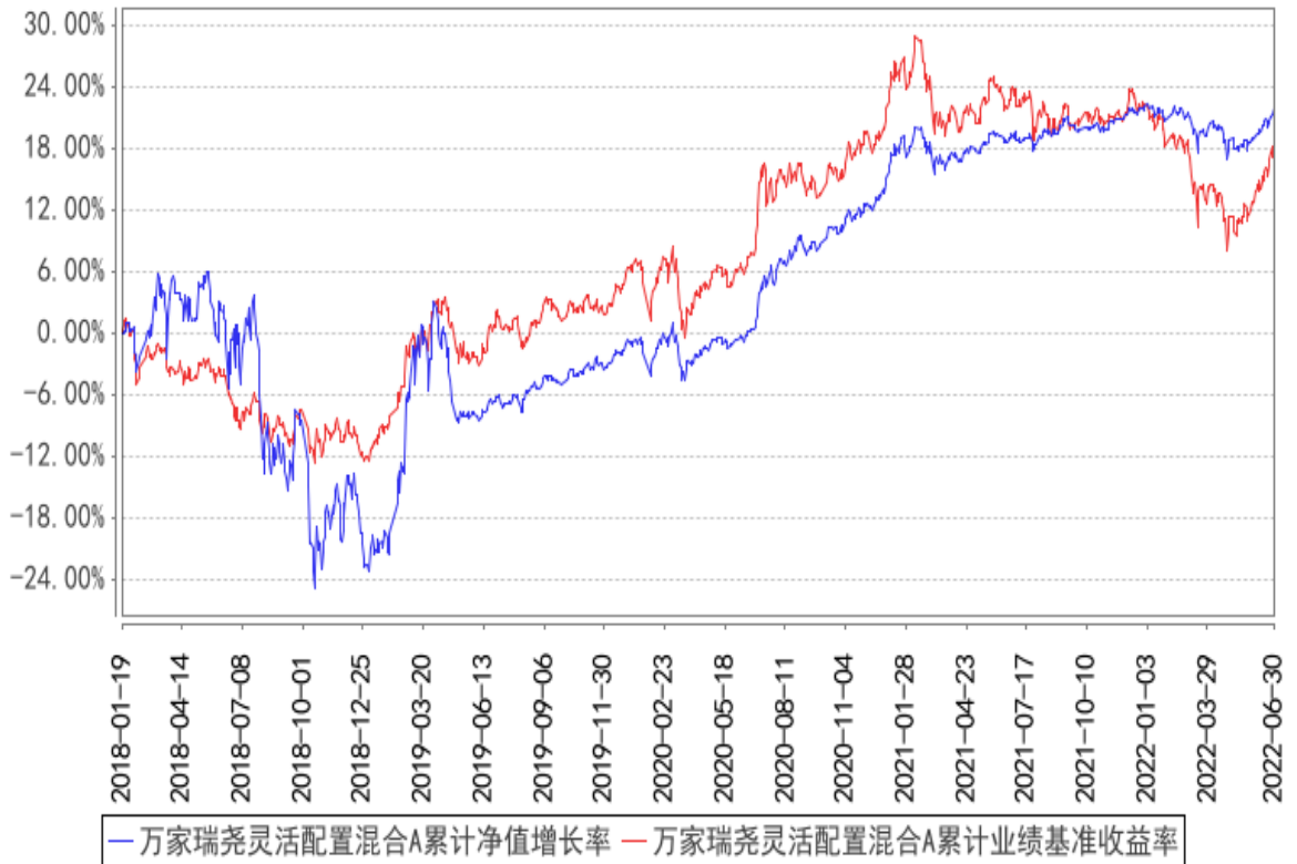
万家瑞尧灵活配置混合A累计净值增长率与同期业绩比较基准收益率的历史走势对比图

(二) 自基金合同生效以来基金累计净值增长率变动及其与同期业绩比较基准收益率变动的比较(自基金合同日至2022年06月30日)