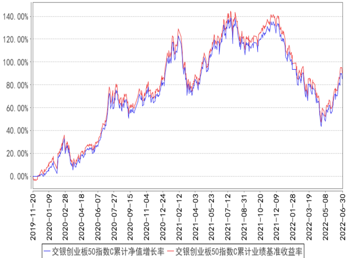
交银创业板50指数C累计净值增长率与同期业绩比较基准收益率的历史走势对比图

注：本基金建仓期为自基金合同生效日起的6个月。截至建仓期结束，本基金各项资产配置比例符合基金合同及招募说明书有关投资比例的约定。