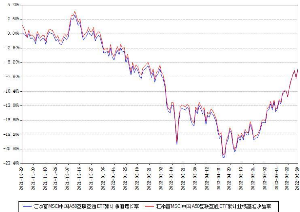
汇添富MSCI中国A50互联互通ETF累计净值增长率与同期业绩基准收益率对比图